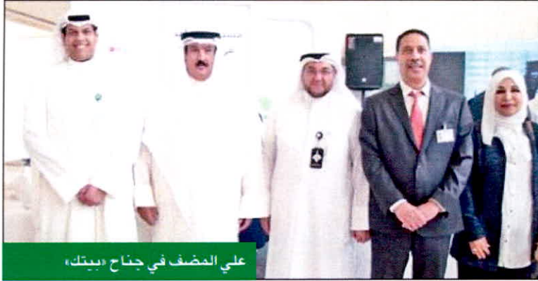
علي المصنف في جناح «بيتك»

المستمر بالطلبة، وتطوير ودعم القدرات الشبابية الوطنية، وتشجيعهم على التركيز على اتجاهاتهم العلمية واختيار الاختصاص الذي يناسب ميولهم العلمية والدراسية، ليتمكنوا من تحقيق النجاح مستقبلاً، كل في مجال عمله.