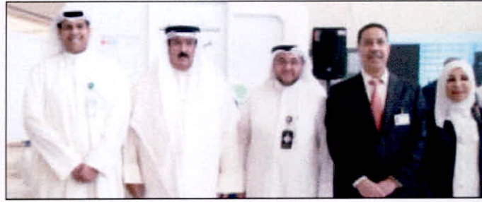
المصنف في جناح «بيتك»

وفي القطاع المصرفي بشكل خاص، ويزيد الوعي لديهم بالتخصصات الملائمة للعمل المصرفي بمختلف قطاعاته. ووقع «بيتك» مذكرة تعاون مع الهيئة العامة للتعليم التطبيقي والتدريب، في إطار الجهود الرامية للتنبؤ بمستوى الطلبة وإعدادهم علمياً وثقافياً واجتماعياً. وأفاد بان الاتفاقية تضمنت بنوداً عدة، أبرزها دعم الأنشطة التي تنظمها «الهيئة» في مجال الأعمال والمواضيع ذات الصلة، مثل روح المبادرة للمشاريع الصغيرة، وتوفير إطار من التعاون والتنسيق بين الأطراف في ما يخص رعاية الأنشطة الطلابية والتعليمية، والمشاركة بمعارض الفرص الوظيفية وحفلات التخرج، وأنشطة عمادة شؤون الطلبة، والمشاركة في دعم الرحلات الطلابية الخارجية التدريبية والثقافية وغيرها من أشكال الدعم المختلفة.