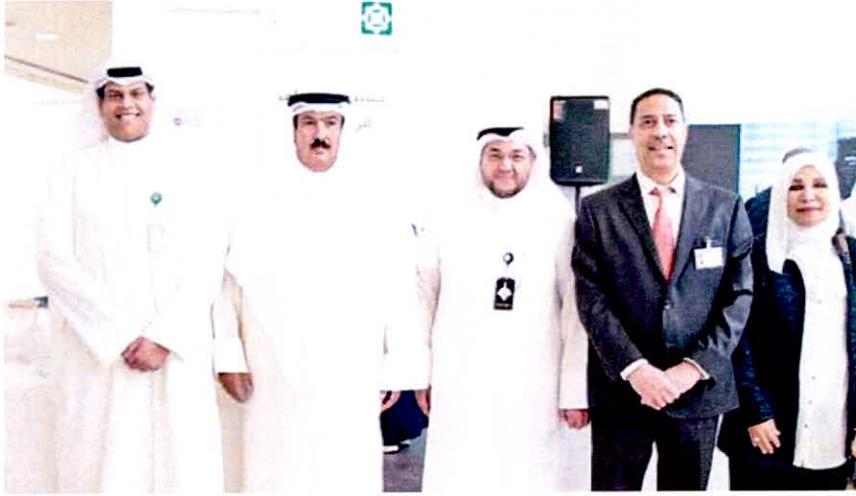
الصف، قس، جناح «بيتك»

شارك بيت التمويل الكويتي (بيتك) في معرض القبول والتسجيل الأول للهيئة العامة للتعليم التطبيقي والتدريب، ضمن اطار الاهتمام بالطلبة والحرص على التواجد بمختلف الفعاليات التي تدعم العملية التعليمية، بما يعزز استراتيجية البنك في تحقيق التنمية المستدامة من خلال التركيز على الشباب وتنمية قدراتهم.